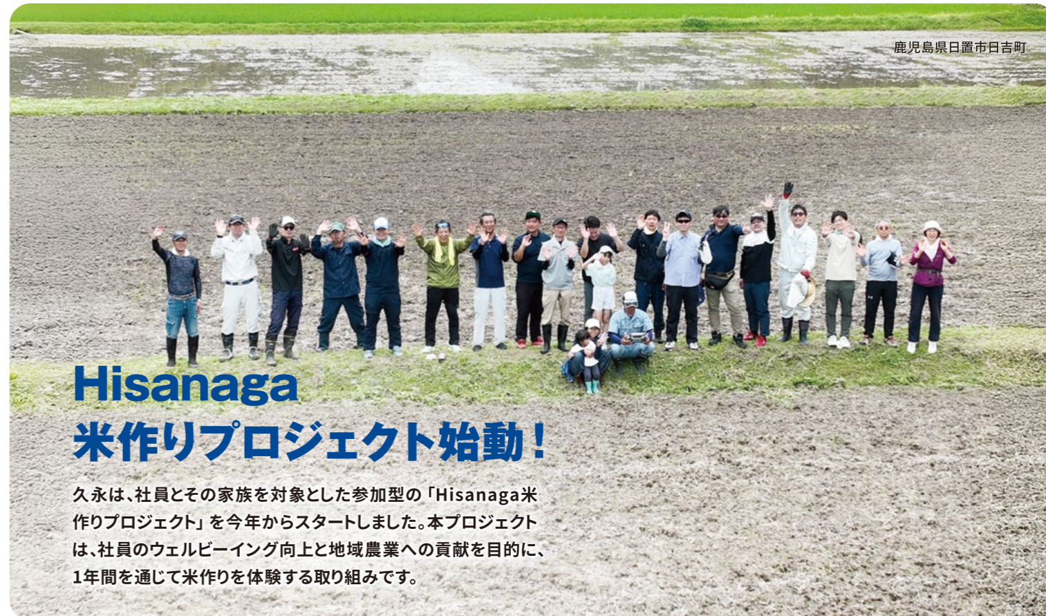
鹿児島県日置市日吉町

常に技術が進化する時代だからこそ、それを使いこなす「人」の力が欠かせません。久永は、学びを支えるパートナーとして、お客様と共に歩んで参ります。