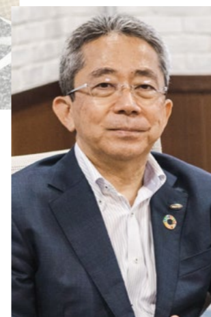
株式会社久永 代表取締役社長