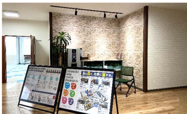
喫煙室を廃止し無料ドリンクサーバー設置