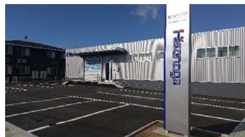
宮崎支店「ZEB Ready」「BELS 評価★★★★★」